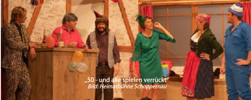
„50 - und alle spielen verrückt“